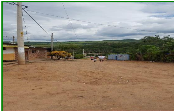
Jr. San Martín C-1 ahuellamientos y charcos en calzada, cunetas inexistentes.