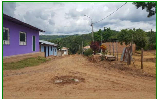
Jr. La Libertad C-2, mal estado de calzada, cunetas inexistentes.