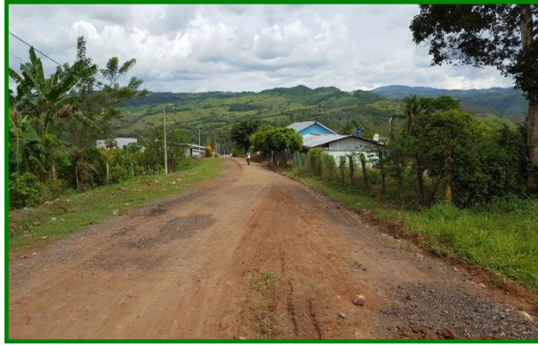
Jr. San Martín C-5, cunetas y veredas inexistentes