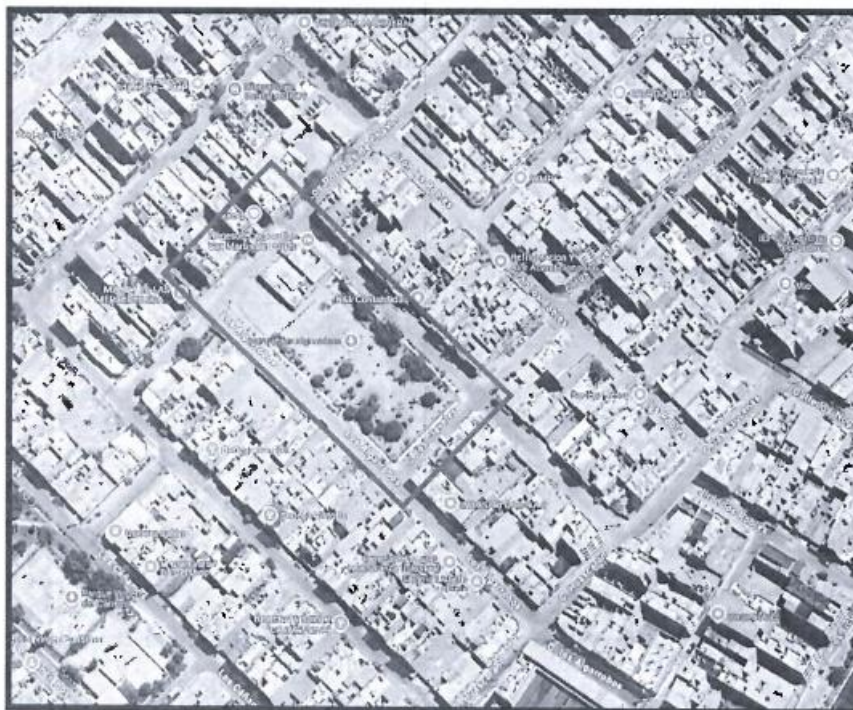
Imagen satelital del área del proyecto