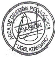
CUADRO DE DISTRIBUCIÓN DE MATERIALES EDUCATIVOS MINEDU Y/O FUNGIBLE CEBEA - 2023