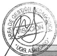
CUADRO DE DISTRIBUCIÓN DE MATERIALES EDUCATIVOS MINEDU Y/O FUNGIBLE INICIAL-2023