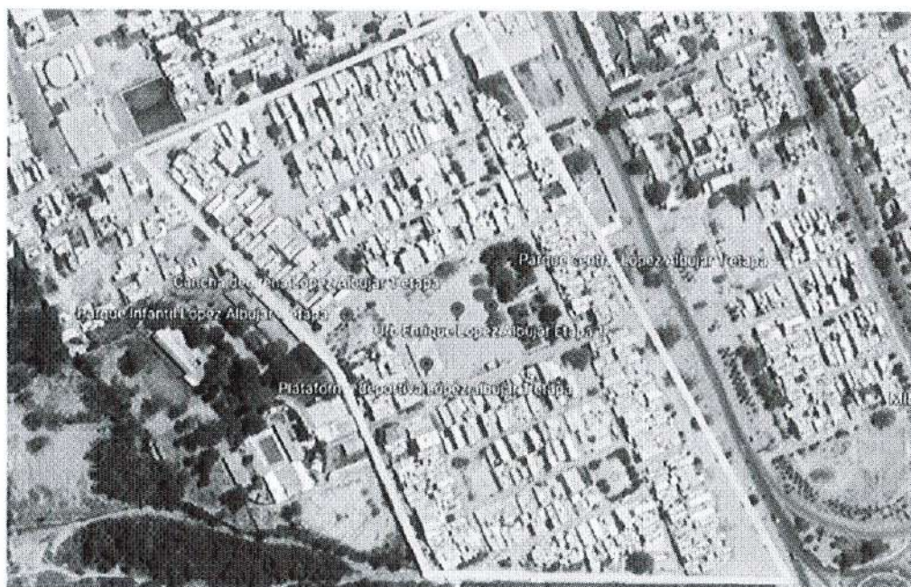
Imagen satelital de la Urb. López Albújar I Etapa