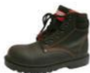
ZAPATO DE SEGURIDAD