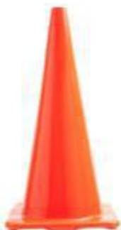
CONO DE SEGURIDAD