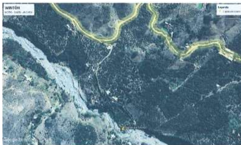
Vista del Área de Intervención del Proyecto