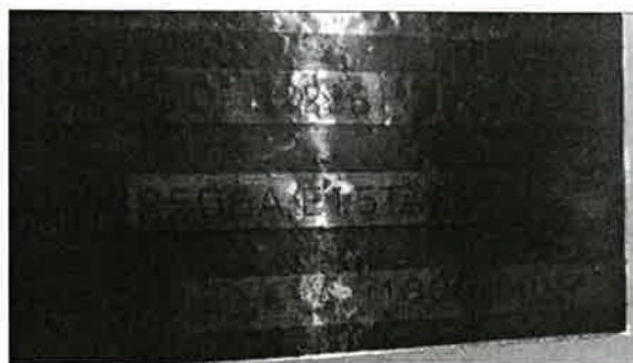
Figura 1: "Placa del Motor G.E. Perkins 3