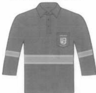
Polo manga Larga cuello camisero Adelante