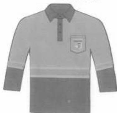
Polo manga Larga cuello camisero Adelante