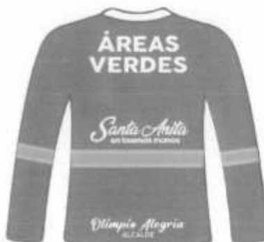
Polo manga larga cuello redondo Espalda