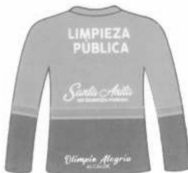
Polo manga larga cuello redondo Espalda