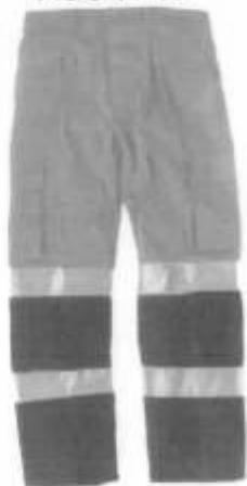
Pantalon Drill Adelante