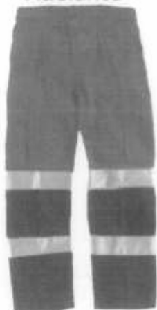
Pantalon Drill Adelante