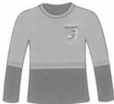
Polo manga larga cuello redondo Adelante