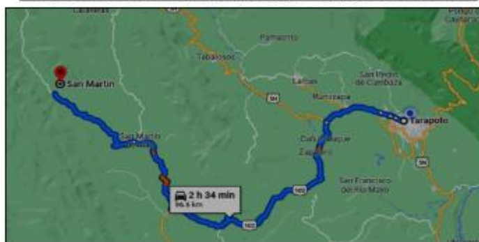
Tabla 1 – Vías de Acceso al lugar de la intervención