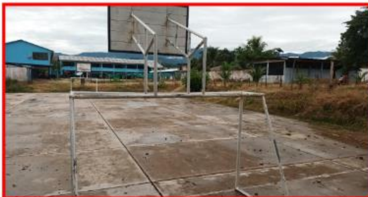
Imagen 2 – Área para la construcción de techado cobertura metálica liviano de la II.EE 0309 Túpac Amaru II.