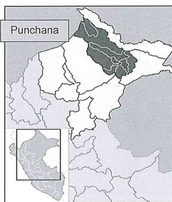
IMAGEN N°02: Localización del distrito de Punchana.

Departamento : Loreto Provincia : Maynas Distrito : Punchana Dirección : Av. La Marina KM 4.5 Zona : Urbana