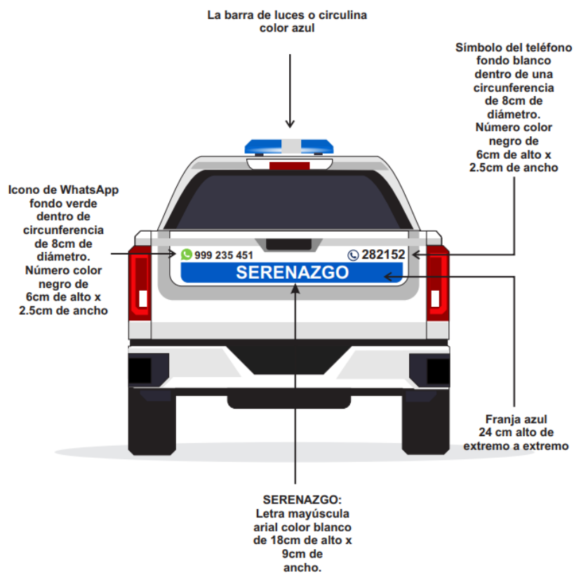
Gráfico 03: LATERAL