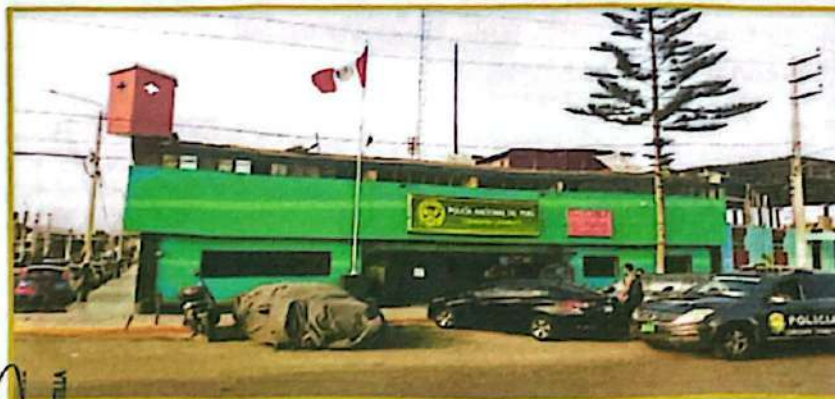
COMISARÍA PNP CHIMBOTE

TÉRMINOS DE REFERENCIA PARA EL SERVICIO DE MANTENIMIENTO E INSTALACIÓN DE COBERTURA METÁLICA, IMPERMEABILIZACIÓN DE TECHO, Y PINTADO DE LAS INSTALACIONES DE LA COMISARÍA PNP CHIMBOTE, DISTRITO CHIMBOTE, PROVINCIA DE SANTA, DEPARTAMENTO DE ÁNCASH.