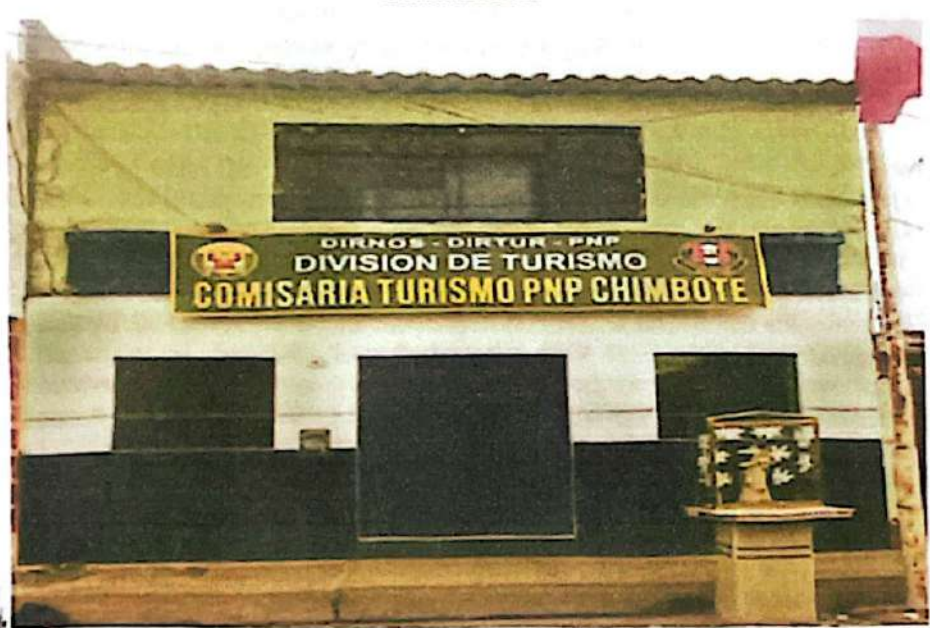
COMISARÍA PNP TURISMO CHIMBOTE

DISTRITO CHIMBOTE PROVINCIA SANTA DEPARTAMENTO ANCASH