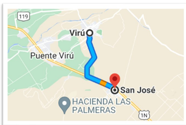
Viru hacia San José