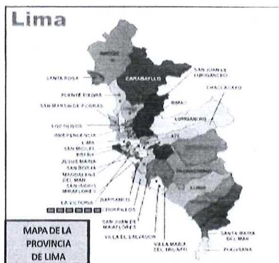
Imagen 2: Mapa de la Provincia