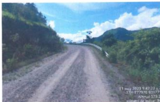
KM 02 + 192: Curva vertical con barreras de seguridad