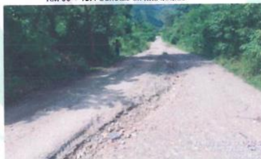
KM 01 + 009: Deterioro de la capa de afirmado en la vía