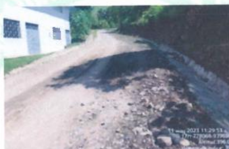
KM 00 + 157: Cunetas en mal estado