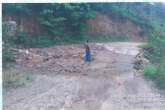
KM 5 + 164: Deslizamiento de tierra afectando al badén existente