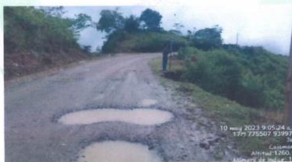
KM 10 + 178: Afectación de ciertos tramos de la vía por lluvias