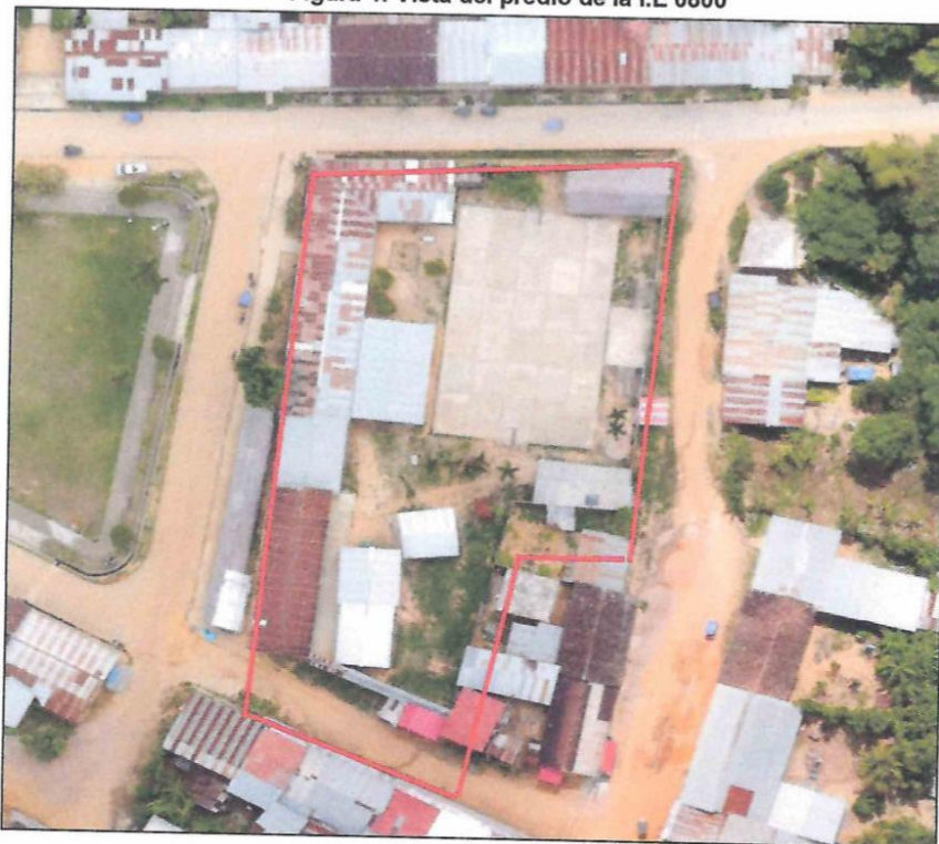
Figura 4: Vista del predio de la I.E 0800

En la elaboración del presente estudio se aplicará y/o utilizará fuentes de información primaria y secundaria disponibles que les permita una correcta identificación del problema y la población afectada. El consultor deberá contar con el equipo técnico profesional e instrumentos de ingeniería necesarios para la reformulación del Proyecto.