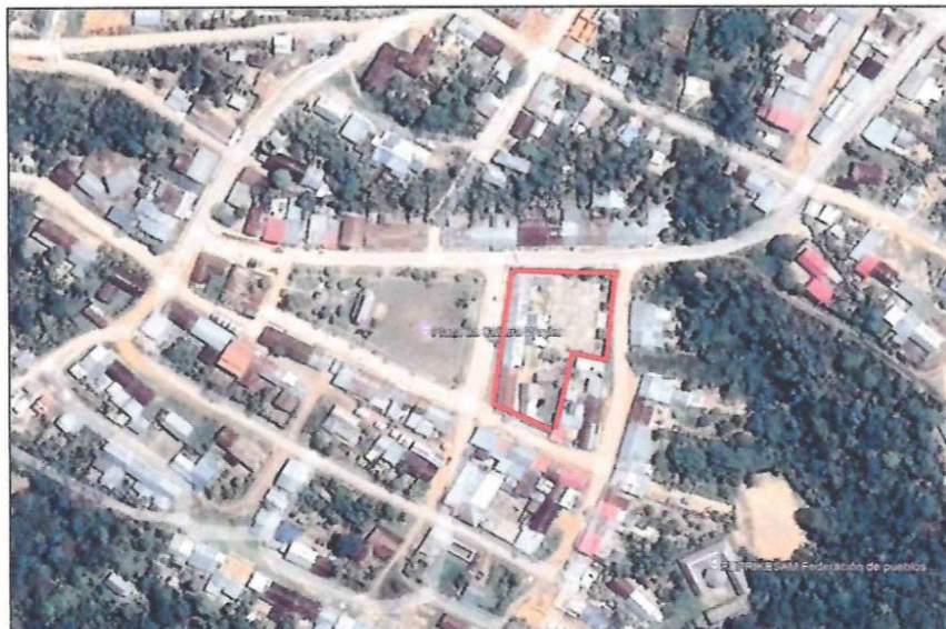
Imagen 04: Ubicación del Proyecto

"Año del Bicentenario, de la consolidación de nuestra Independencia, y de la conmemoración de las Heroicas Batallas de Junín y Ayacucho"