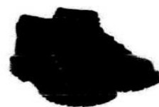
Zapatos de Seguridad con Puntera de Acero