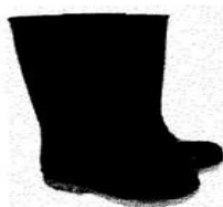
Botas de Jefe