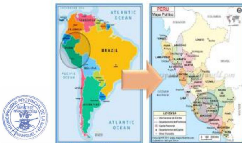
FIGURA N° 01 - MAPA DE UBICACIÓN MACRO