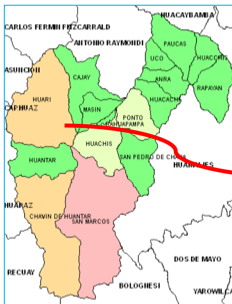
Provincia de Huari