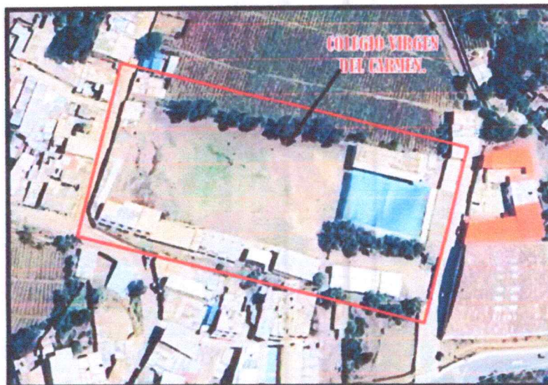
IMAGEN N°01: UBICACIÓN DEL COLEGIO VIRGEN DEL CARMEN EN EL GOOGLE EARTH