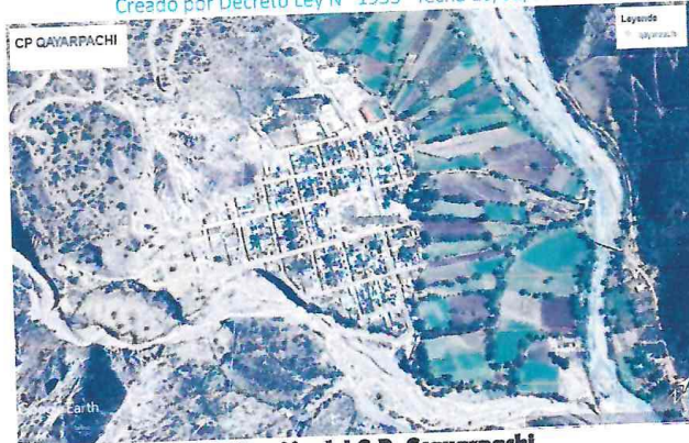
Localización del C.P. Cayarpachi

continuación, se muestra un resumen de las metas del proyecto: