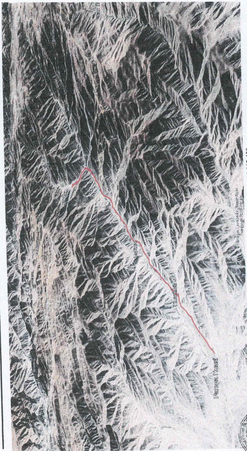
Imagen 1. Ubicación de la vía departamental IC-106.