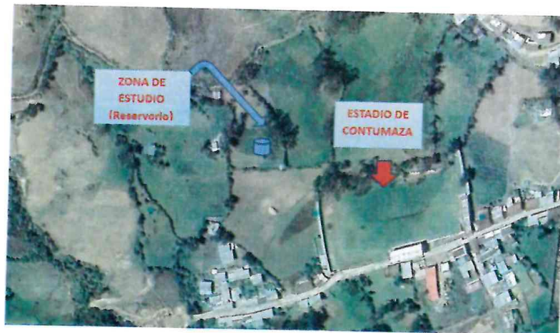
Imagen N° 1: Localización del Proyecto.