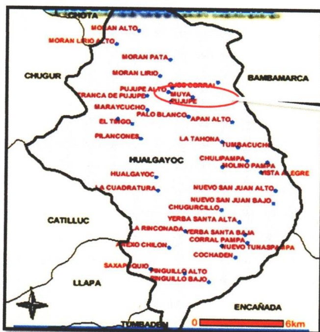
Gráfico N° 03 – Ubicación del Proyecto: Muya