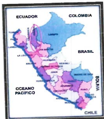
LOCALIZACIÓN GEOGRÁFICA DEL DEPARTAMENTO DE AMAZONAS