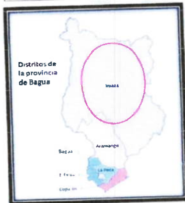
LOCALIZACIÓN GEOGRÁFICA DEL DISTRITO DE IMAZA