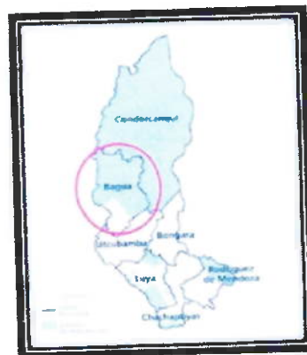
LOCALIZACIÓN GEOGRÁFICA DE LA PROVINCIA DE BAGUA