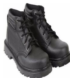
Zapato de seguridad Puntera Acero