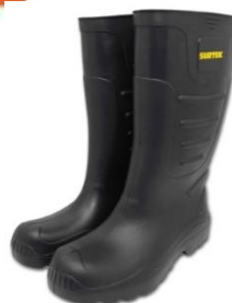
Bota de Jebe