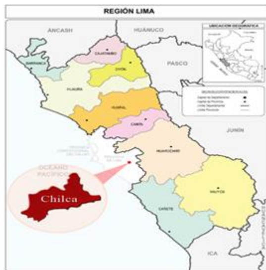
Fig. 01: Ubicación del Distrito de Chilca