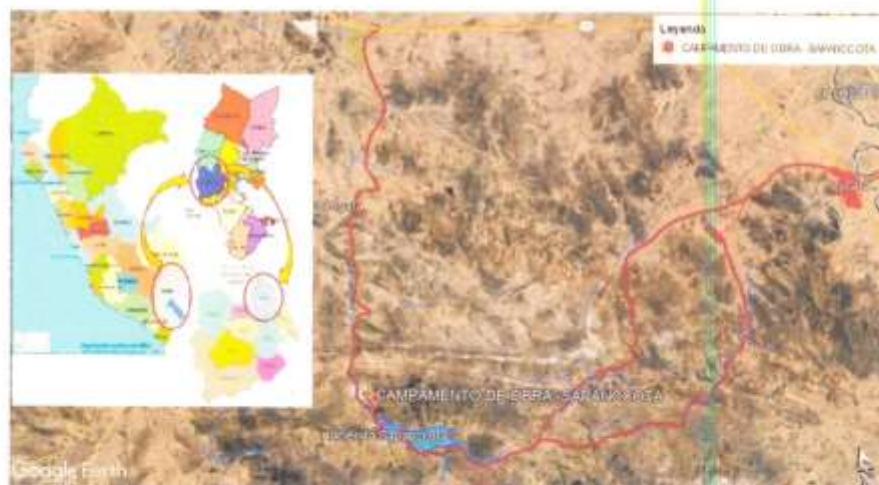
Accesos a la obra - Sapancota