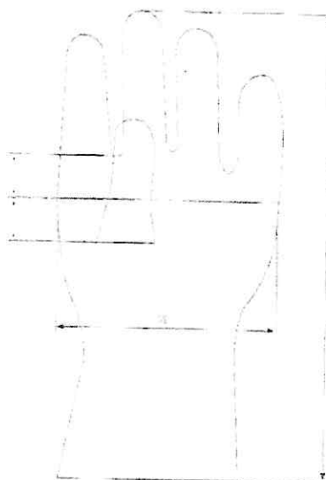
Figura referencial: Puntos de medición para espesor del guante