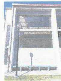
Imagen 03: tratamiento anti salitre en muros exteriores.