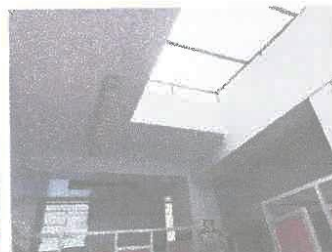
Imagen 03: Cielo raso en ss.hh. se visualiza descascaramiento de pintura.