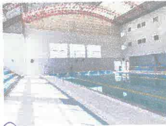
Imagen 13: Suciedad en muros internos de piscina, se verifica zonas salitrosas.