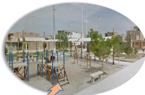
PARQUE “EL NIÑO” URB. IZABEL BARRETO