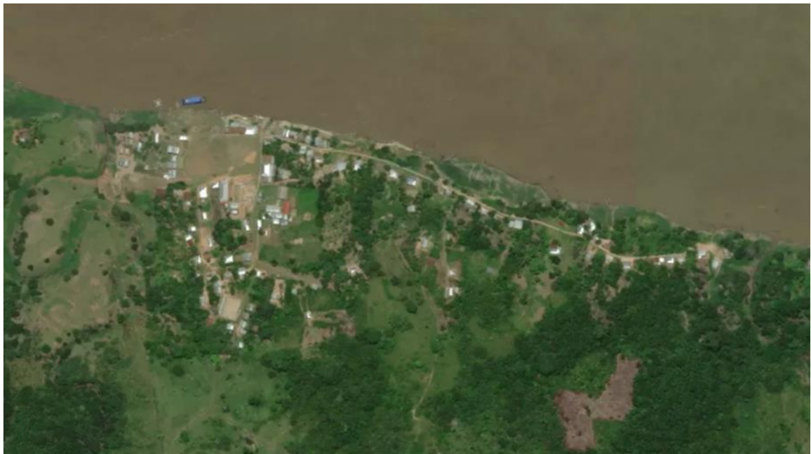
IMAGEN 01: VISTA SATELITAL DEL ÁREA DEL PROYECTO BEIRUTH