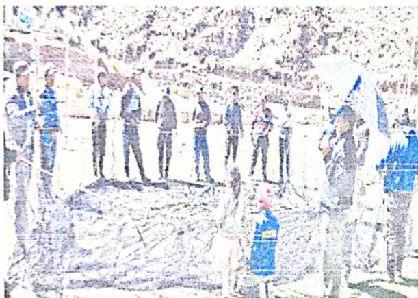
Imagen referencial (bolsa de malla)

Las bolsas de malla deben ser confeccionadas en paño nylon para uso acuicola de medida 10mx10mx6m de cocada 1 ½" en hilo N°36, con embande del 30% mínimo y el cabo de esqueleto puede ser de ¼".