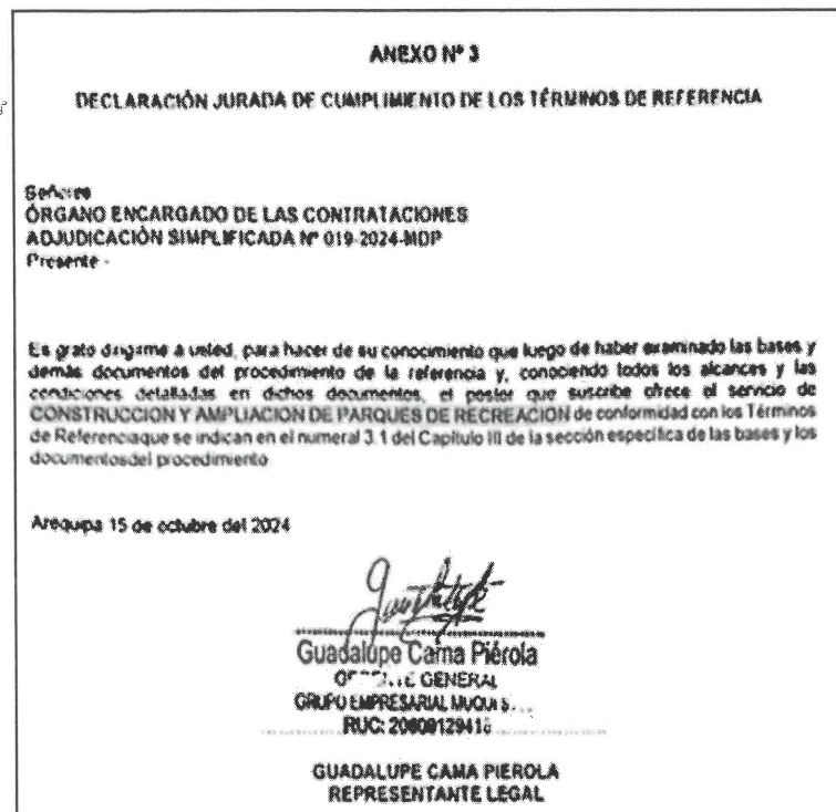
Imagen N° 03: Anexo N°3 – “DECLARACION JURADA DE CUMPLIMIENTO DE LOS TERMINOS DE REFERENCIA” de la oferta del postor MUQUI ASOCIADOS S.R.L.

(...) “CONSTRUCCION Y AMPLIACION DE PARQUES RECREATIVOS”.