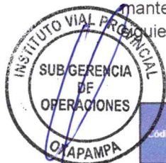
Cuadro 5.4.1: PRIMERA PRIORIDAD: SEGURIDAD DE VIAJE

❖ Al que incumpla con el logro de los indicadores de resultados de las actividades de mantenimiento rutinario consideradas de primera, segunda y tercera prioridad, corresponderá la siguiente sanción: