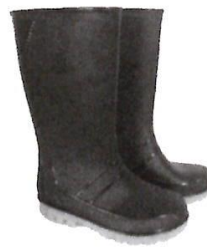
Botas de Jebe