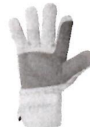
Guantes de Seguridad de Obra