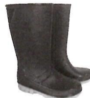
Botas de Jebe