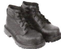
Zapatos de Seguridad con Puntera de Acero