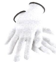
Guantes de Seguridad de Obra