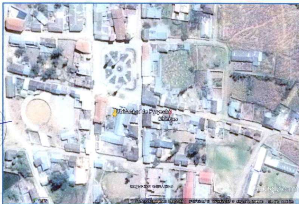
GRAFICO 02: Ubicación del Proyecto