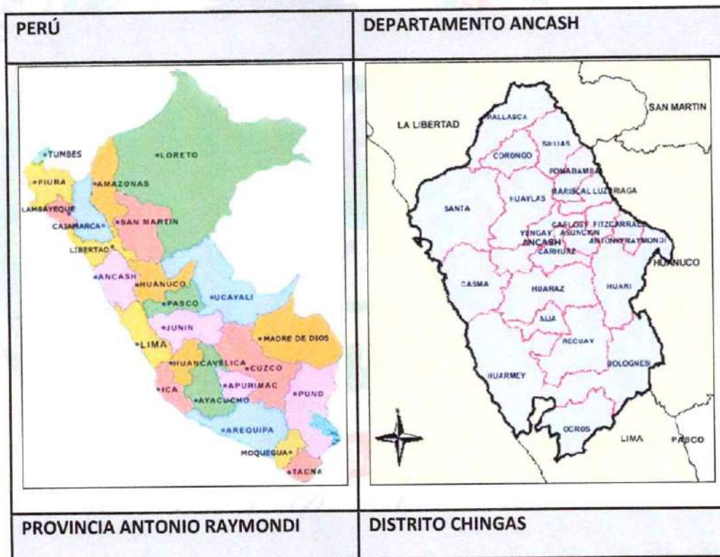
GRAFICO 01: Macro Localización del Distrito de Chingas