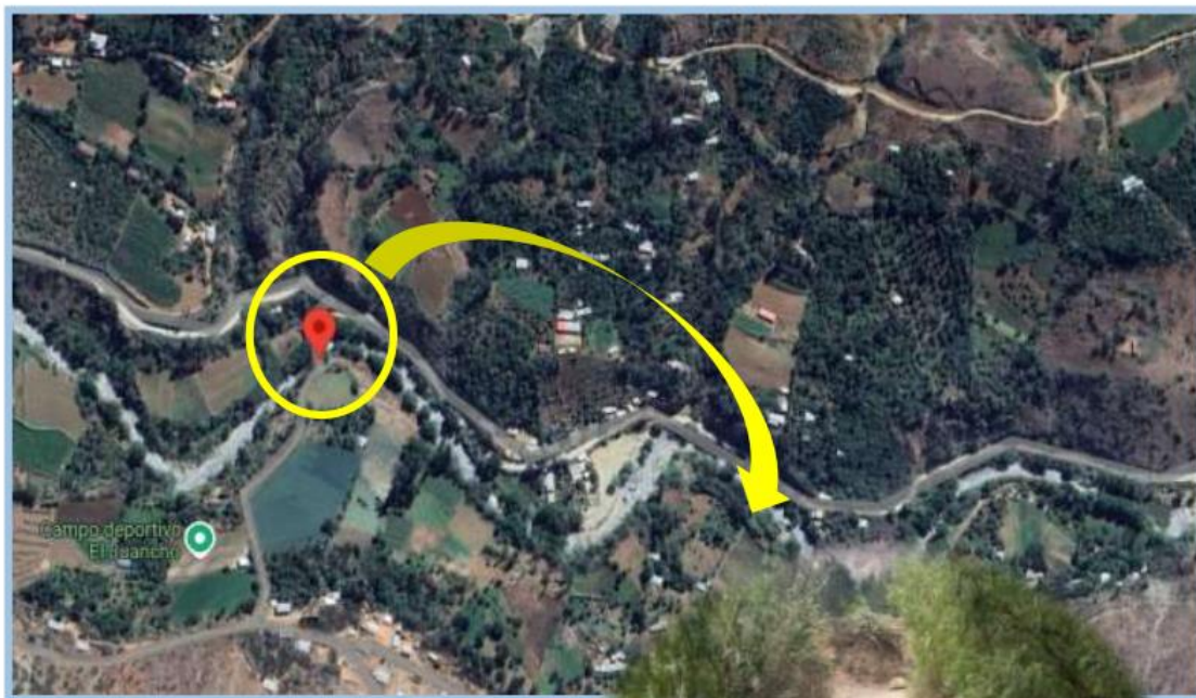
Ilustración 1. Ubicación Google Earth Pro del Puente Huarangopampa

Nivel de los Estudios de Inversión Expediente Técnico