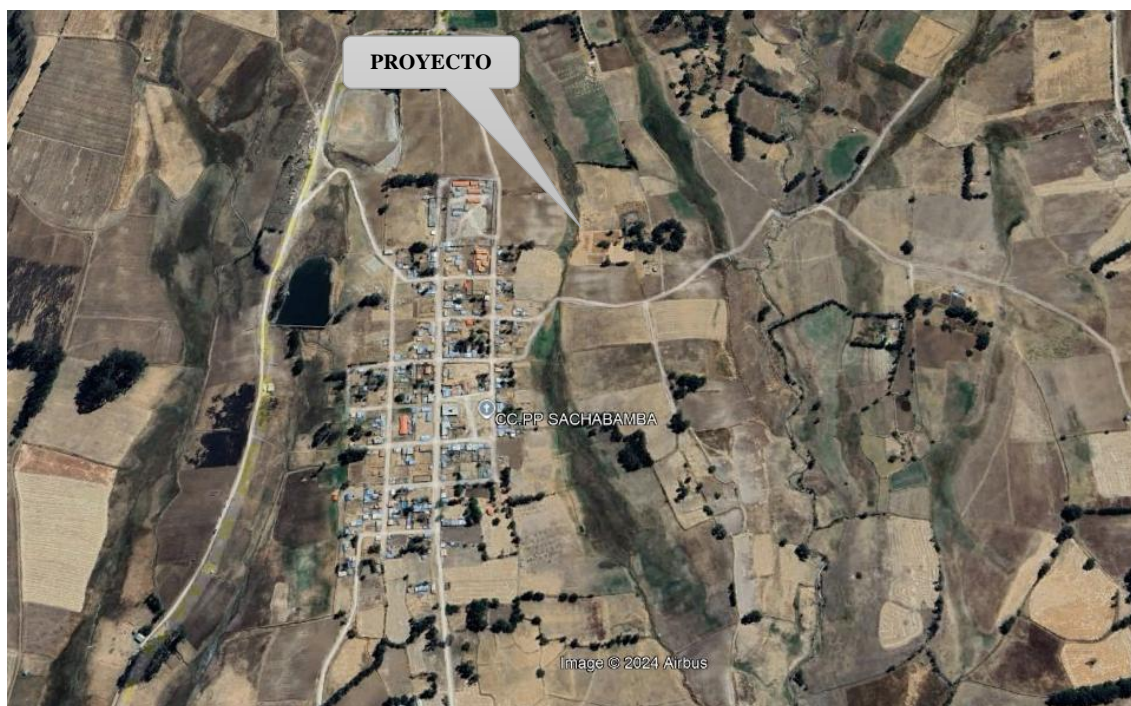
Imagen N° 02: Ubicación del Grass sintético de C.P. Sachabamba.