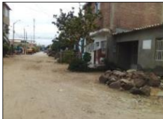
Ubicación: Calle N°01