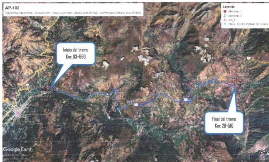
Imagen: Vista satelital del tramo a intervenir

Carretera Panamericana Sur Lima-Chincha-San Clemente, la cual es una vía asfaltada y pertenece a la Ruta Nacional N°1-S, desde San Clemente se continua por la vía Libertadores Wari pasando por las localidades de Huaytara - Allpachaca - Ahuayro - Uruca hasta llegar a la Provincia de Andahuaylas, esta vía es asfaltada la cual forma parte de la carretera 28A y la ruta nacional 3S, para llegar a la ciudad de Andahuaylas se recorre un total de 759 km aproximadamente en bus, representado este un total de aproximadamente 15 horas de viaje.