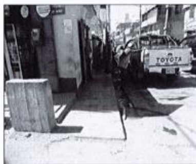
Cruce Av. El Salvador y Mariscal Cáceres. Se encuentra en proceso de deterioro de sus partes y elementos de

OBRA: "MEJORAMIENTO Y REHABILITACION DE LA AV. MARISCAL CÁCERES DE LA INTERSECCIÓN GUERRADA TAJAHUAYCO-JR. FAUCETT ULTIMA CUADRA, DISTRITO DE AYACUCHO, PROVINCIA DE HUAMANGA – AYACUCHO".