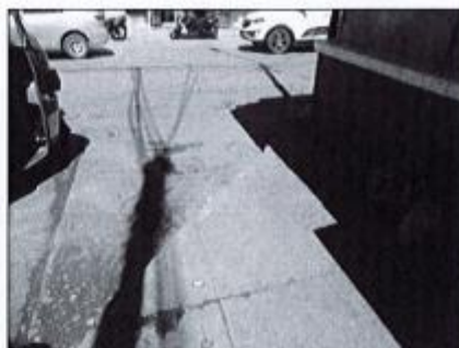
Cruce Mariscal Cáceres – Jr. Roma.