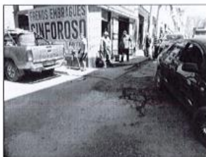
Cruce entre Av. Mariscal Cáceres – Jr. Protzel, Presenta deterioro de sus partes a causa del tiempo y uso.