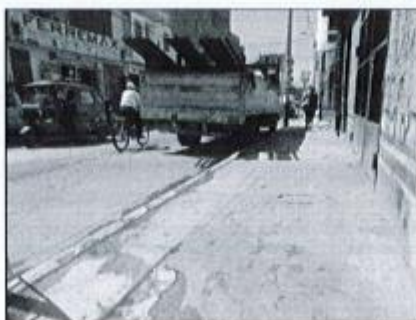
Sector intermedio de Av. Mariscal Cáceres de la cuadra 4. Inexistencia de sistemas de drenaje pluvial y veredas desgastadas.