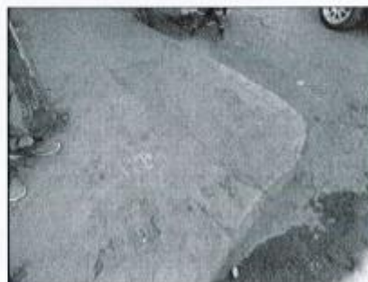
Cruce Mariscal Cáceres – Jr. Roma. Se encuentra en proceso de deterioro presentando fisuras y desgaste a causa del tiempo.

OBRA: "MEJORAMIENTO Y REHABILITACION DE LA AV. MARISCAL CÁCERES DE LA INTERSECCIÓN QUEBRADA TAIWUAYCCO-JR. FAUCETT ULTIMA CUADRA, DISTRITO DE AYACUCHO, PROVINCIA DE HUAMANGA – AYACUCHO".