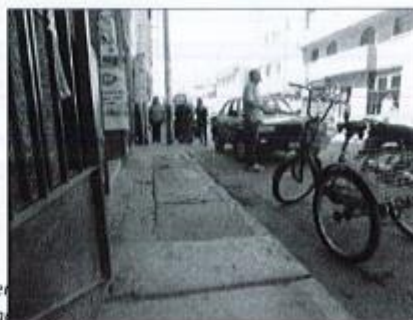
Sector intermedio de Av. Mariscal Cáceres de la cuadra 4. Deterioro y desgaste de veredas.