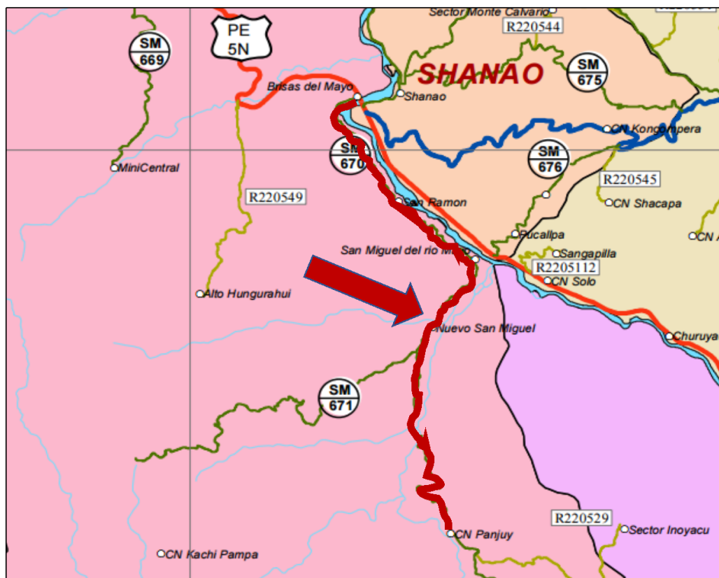
Fig. 01. EMP. PE-5N (PTE. BOLIVIA) - SAN MIGUEL DEL RIO MAYO - PANJUI (KM 12+500).

Servicio de ejecución del mantenimiento rutinario del camino vecinal, Tramo: EMP. PE-5N (PTE. BOLIVIA) - SAN MIGUEL DEL RIO MAYO - PANJUI (KM 12+500).