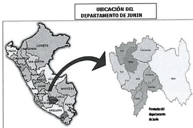
Ilustración 1 Ubicación del departamento de Junín

Av. Javier Prado Oeste N° 2442 Urb. Oarrantia, Magdalena del Mar – Lima 17 T. (511) 225-9005 www.gob.pe/serfor www.gob.pe/midagri