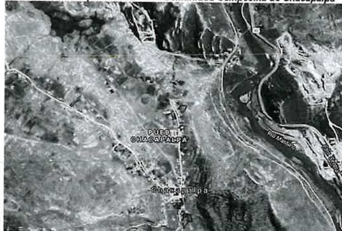
Ilustración 2 Mapa Satelital de la Comunidad Campesina de Chacapalpa

"Peru suyunchikpa Iskay Pachak Watan: iskay pachak watañam qispisqanmanta karun"