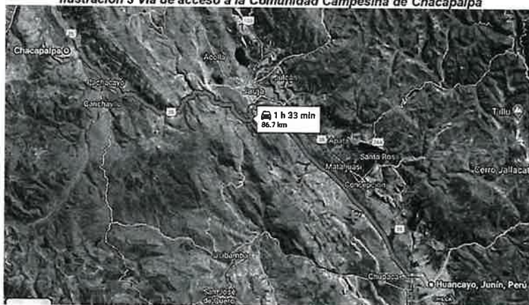
Ilustración 3 Vía de acceso a la Comunidad Campesina de Chacapalpa