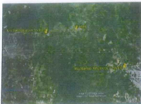
Mapa N° 02- Mapa de Ubicación Longitudinal del Proyecto

PROYECTO DE OBRAS DE INFRAESTRUCTURA VIAL