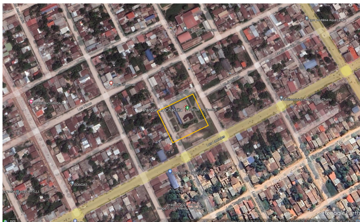
Figura N°. 1: Mapa de ubicación del proyecto