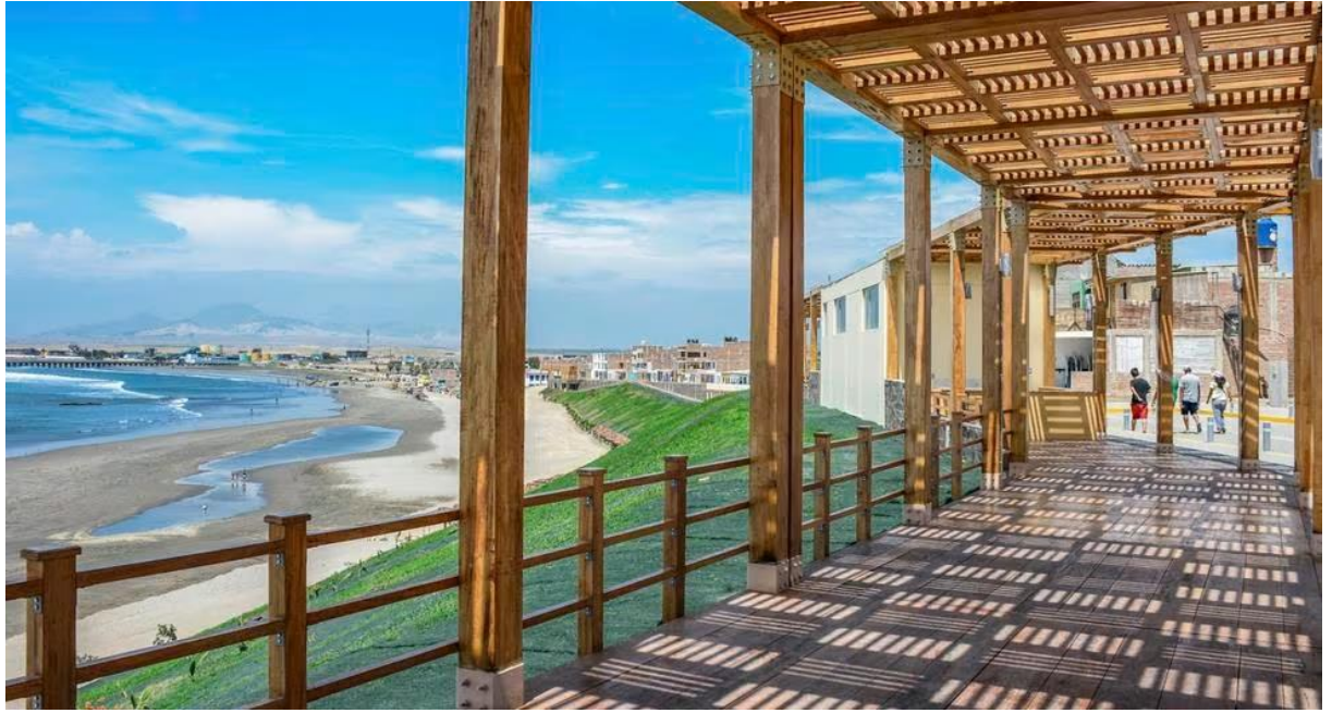
FUENTE: IMAGEN DEL MALECON TURISTICO DE PUERTO MALABRIGO