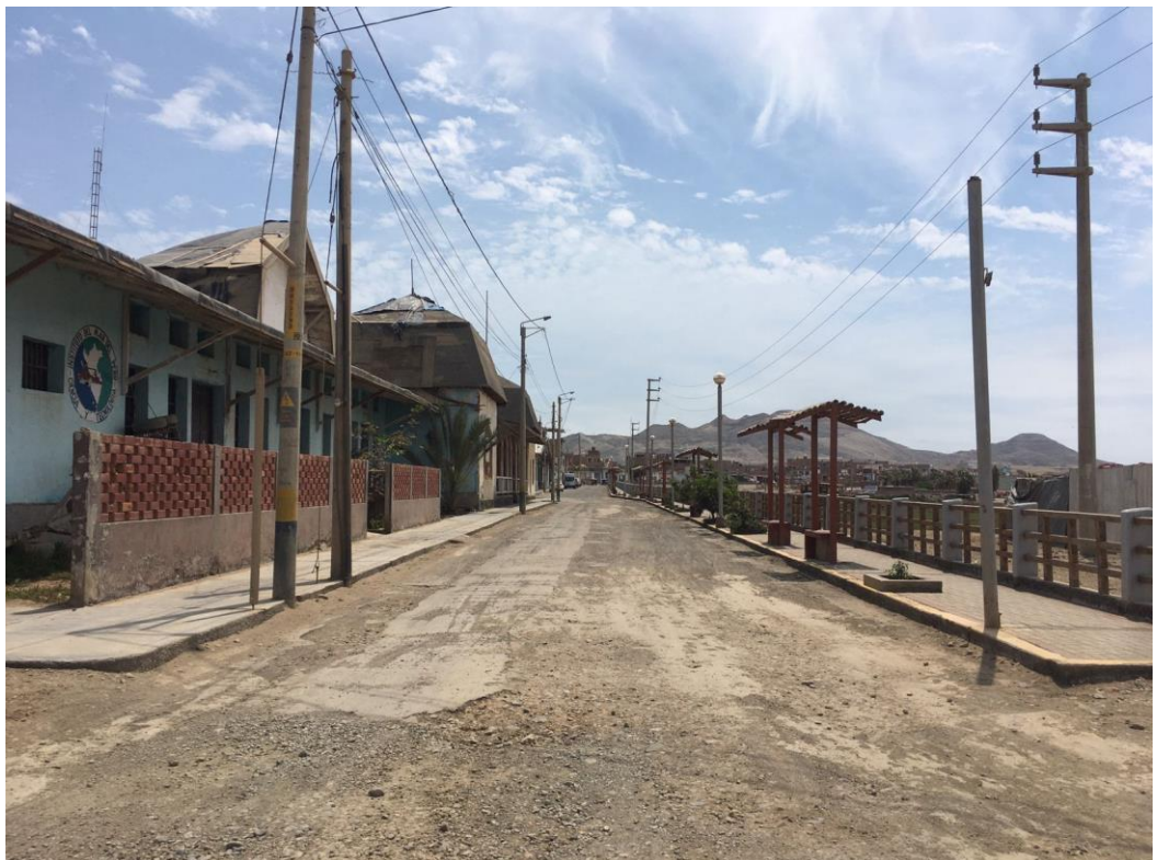
FUENTE: ESTADO SITUACIONAL DE PROLONGACIÓN TACNA