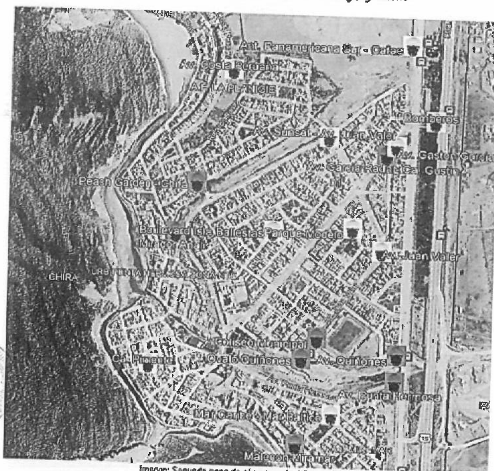
Imagem: Segunda zona de câmaras a instalar-se e interconectar

"Año del Bicentenario, de la consolidación de nuestra Independencia y de la conmemoración de las heroicas batallas de Junín y Ayacucho"