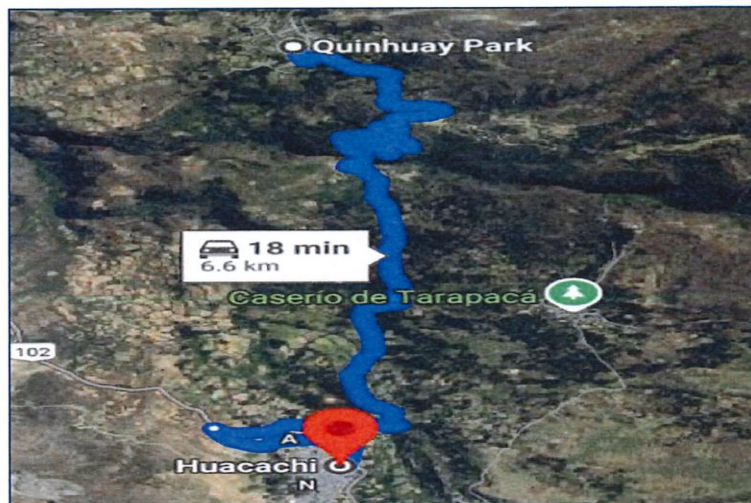
Lugar del proyecto. Google Maps.

El acceso a la localidad de Vioc desde la ciudad de Huaraz, se encuentra descrita según el cuadro que a continuación de detalla: