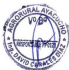
CUADRO N° 3: Certificación de calidad del bien